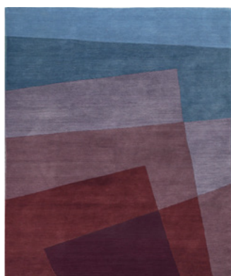
blue - purple