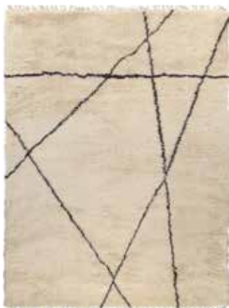
ivory /dark grey